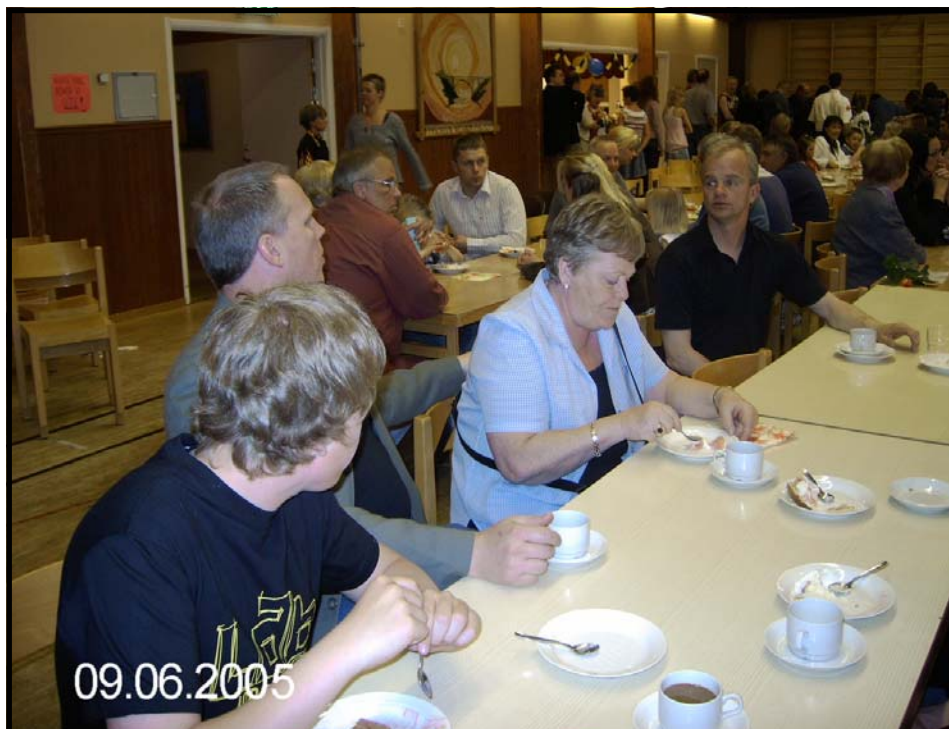
Här ser vi några som fikar på skolavslutningen 2005

Tävlingen från förra numret var det ingen som skickade in någon lösning på. Jag beklagar att det blev fel på månaden för datumet för inlämning av de rätta svaren Men de rätta sidorna för fåglarna är på sidorna 6,8,9,10,15.