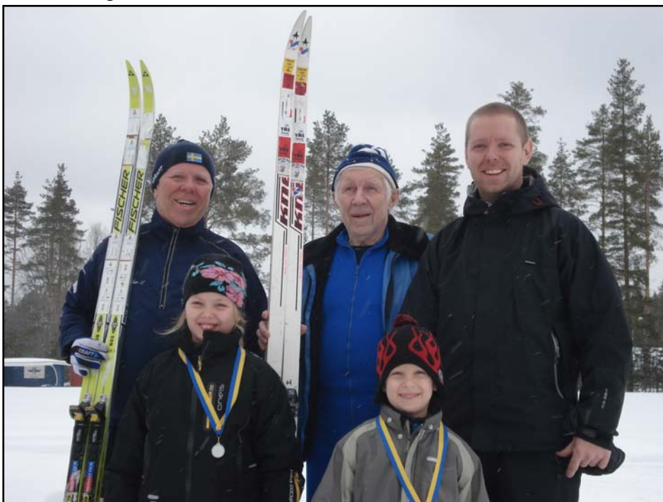
4 generationer Lövgren som har åkt klubbmästerskapet!