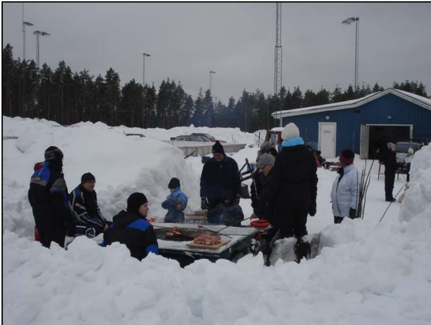
Det grillades korv över elden.