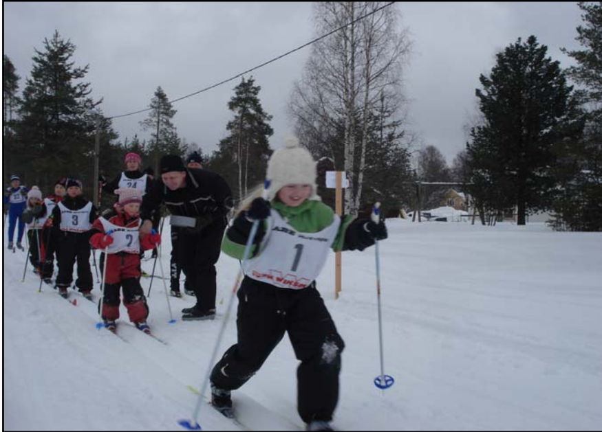
Här åker de för glatta livet.