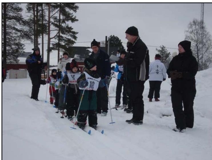
Spänningen är olidlig i spåren!