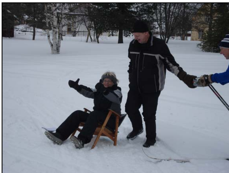
Här går det utför för sekretariatet!