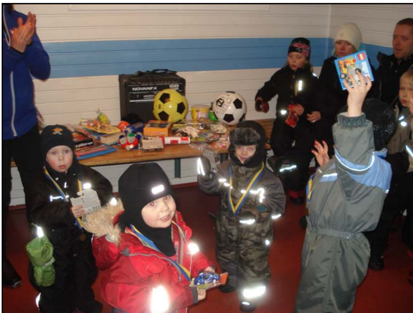
Här är några av vinnarna.