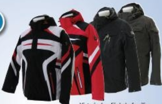
Vinterjackor för hela familjen