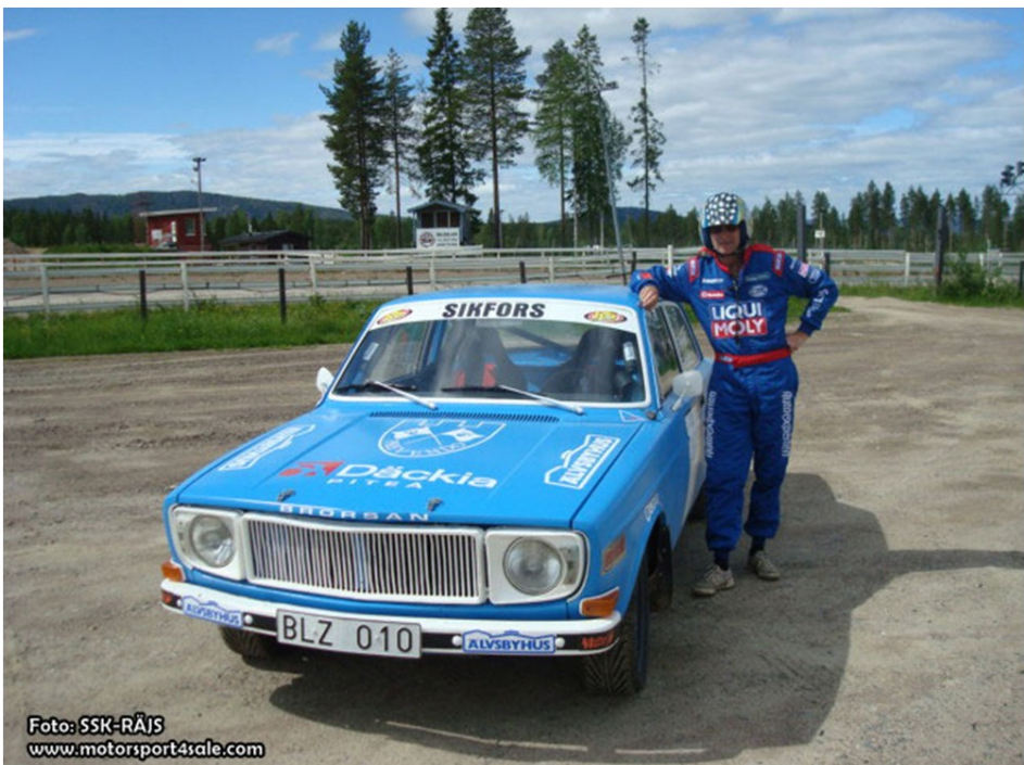
www.motorsport4sale.com