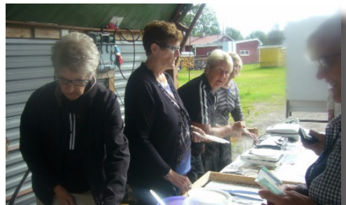
Våfflor på gång för spelare och publik.