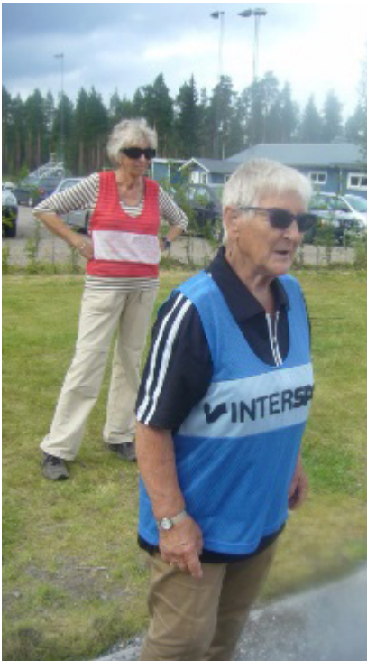
Koncentrerade spelare i finalen.