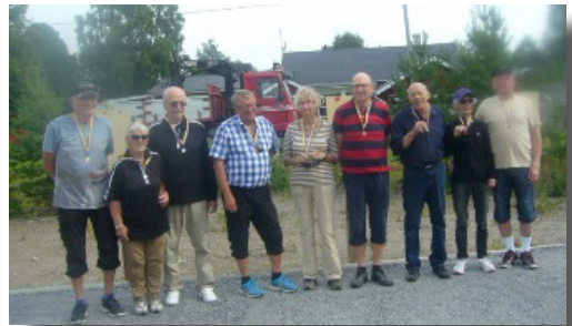
Alla medaljörer samlade på bild.