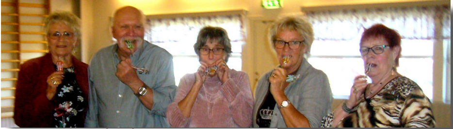
Vinnarna i musiktävlingen

Den 19 oktober samlades över 70 PRO-medlemmar till höstmötet. Mycket glädjande var att vi kunde välkomna 6 nya medlemmar till föreningen. I dagsläget är vi 121 medlemmar (!). Mötet inleddes med lunch, idag en supergod köttfärs-soppa, tillagad av köksansvariga. Efter maten fick vi ett mycket intressant föredrag om stroke av Mats Stenvall, som mycket personligt