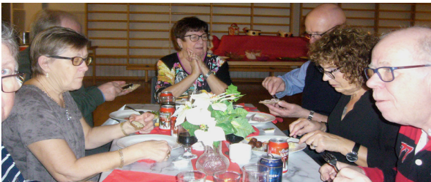
Den trevliga kökspersonalen

Som avslutning serverades kaffe och pepparkaka samt att det gigantiska vinstbordet tömdes. Stort tack till alla som skänkt vinster.